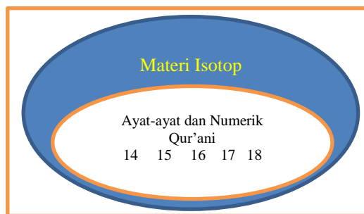
Gambar 3. Model Pengintegrasian Nested Materi Isotop dengan Ayat Al-Qur'an

Keterangan: (14) Qs. Al-Hadiid ayat 25; (15) Total Nilai Numerik kata Al-Hadiid dalam Al-Qur'an; (16) Peletakkan Surat Al-Hadid sebagai surat ke-58 dalam Al-Qur'an jika diurut dari belakang dengan ketepatan perhitungan Allah tentang Isotop Besi 58 sesuai dengan yang tertera dalam Qs.Al-Jinn:28; (17) Penggabungan jumlah ayat pada Qs. Al-Hadiid dan no surat Al-Hadiid dengan jumlah energi ionisasi pada besi; (18) Kesamaan antara jumlah total isotop besi dengan jumlah total kata Al-Hadiid pada Qs. Al-Hadiid.