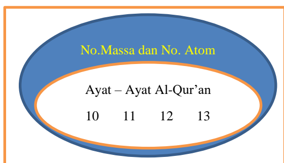
Gambar 2. Model Pengintegrasian Nested Materi Nomor Massa dan Nomor Atom dengan Ayat Al-Qur'an

Keterangan: (10) Perhitungan Perkalian no surat x no ayat x no juz pada Qs. Al-Mu'minun:18; (11) Perhitungan Perkalian no surat x no ayat x no juz pada Qs. Fathir:27; (12) Perhitungan Perkalian no surat x no ayat x no juz pada Qs. An-Naml:61; (13) Perhitungan Perkalian no surat x no ayat x no juz pada Qs. Yunnus:91.