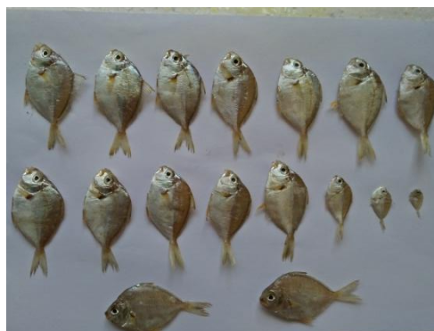
Gambar 1. Sampel Ikan Petek di Perairan Suradadi

Ukuran ikan petek dengan panjang 8,1 – 9,0 merupakan ukuran ikan petek mulai matang gonad (Rao et al., 2015). Dominansi ukuran ikan 6,0-6,9 cm di Perairan Surodadi menunjukkan bahwa di perairan tersebut ikan petek mendekati ukuran matang gonad. Perubahan fekunditas ikan petek disebabkan karena perubahan lingkungan dan ketersediaan makanan (Novitriana et al., 2004). Sampel ikan petek yang diambil dari perairan Suradadi dapat dilihat pada Gambar 1, sedangkan sampel ikan petek di perairan Suradadi pada sampling ke-4 dapat dilihat pada Gambar 2.