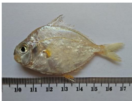
Gambar 2. Sampel Ikan Petek di Perairan Suradadi pada Sampling ke-4

Ikan petek merupakan ikan yang rentan terhadap perubahan kondisi lingkungan terutama makanan. Menurut Pauly (1989) ikan petek ( L. equulus ) memiliki pertumbuhan dan rekrutmen yang tinggi namun tingkat kematian jenis ini cukup tinggi. Hal ini disebabkan karena mobilitas ikan petek sangat rendah yaitu berada disekitar muara sungai dan jarang ditemukan di laut lepas. Perlu adanya upaya manajemen pengelolaan sumberdaya pesisir seperti mengurangi laju penangkapan ikan konsumsi seperti ikan petek (Daud et al., 2016).