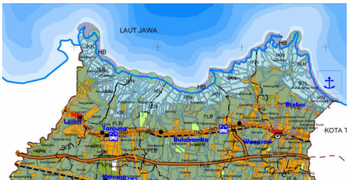
Gambar 3. Pola Tata Ruang Pesisir Kabupaten Brebes

Desa Randusanga Kulon, (3) adanya anggapan masyarakat bahwa hutan mangrove merupakan tempat persembunyian pencuri. Adapun Pola tata ruang pesisir Kabupaten Brebes tersaji pada Gambar 3