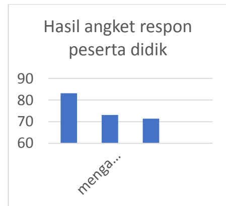
Gambar 2. Diagram Hasil Angket Peserta Didik

Data selanjutnya yaitu analisis angket respon dari peserta didik dengan menggunakan model pembelajaran group investigation. Angket ini berisikan 10 soal butir pertanyaan. Dimana terdiri dari 3 indikator berpikir kritis peserta didik yaitu yang pertama memberikan penjelasan sederhana pada no 1,4,dan 5 yang kedua menerapkan strategi dan taktik pada no 2,3,6,dan 7 yang ketiga menarik kesimpulan pada no 8,9,dan 10. Data analisis angket dapat dilihat pada gambar dibawah ini.